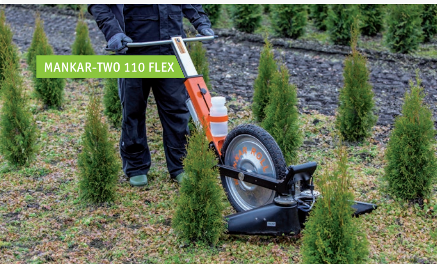
MANKAR-TWO 110 FLEX