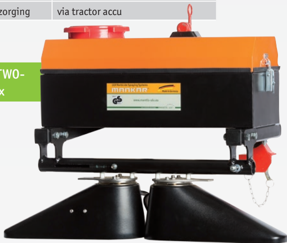
Unima-TWO- E 80 Flex