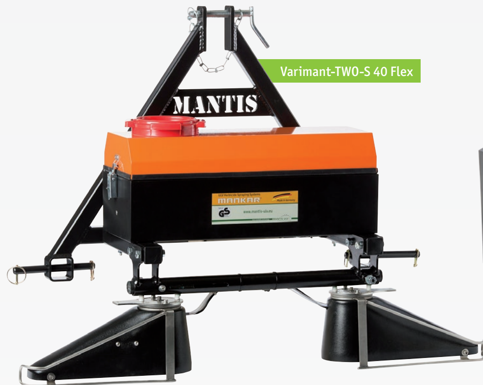
Varimant-TWO-S 40 Flex