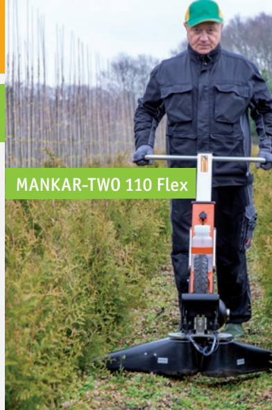
MANKAR-TWO 110 Flex

ONE of TWO = 1 of 2 spuitscherm(en), S = zijwaartse arm