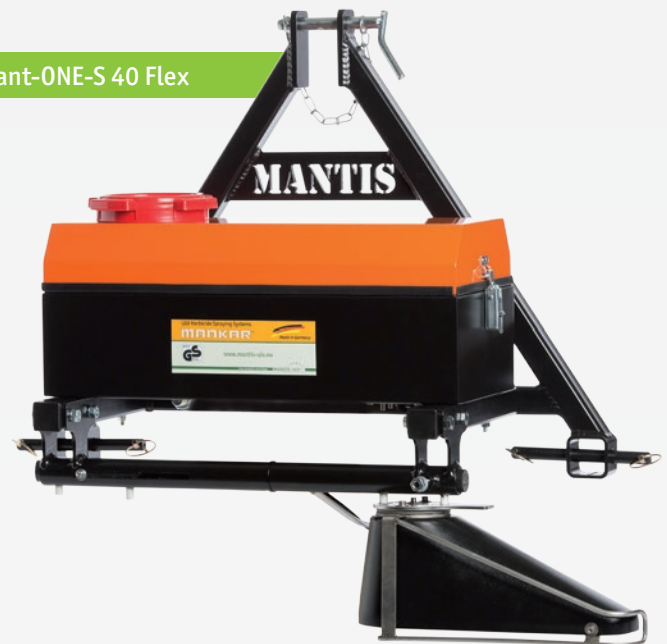
Varimant-ONE-S 40 Flex